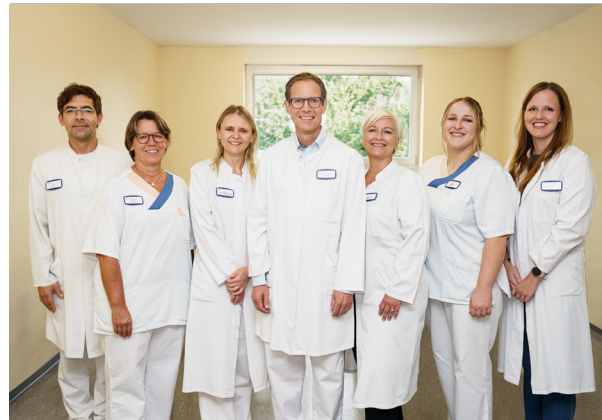
Das Team des Diabeteszentrums